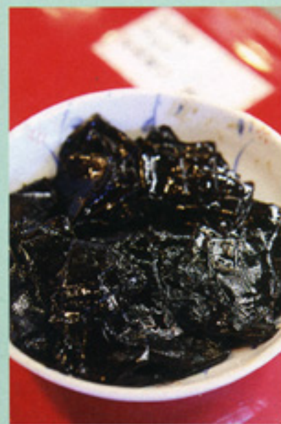
日高昆布(580円)袋入り140g。