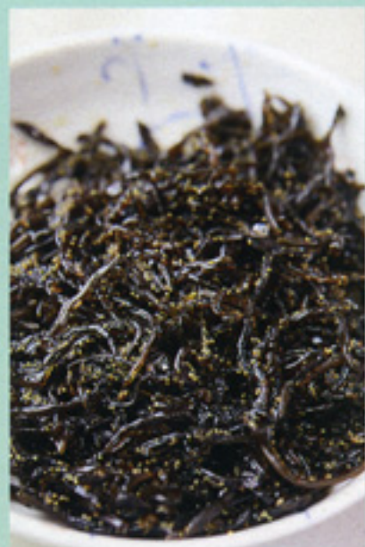
子持ち木くらげ(525円)し しゃもの卵と木くらげのコ リコリとした食感にシソ 風味がさっぱりとして美味。

香川県小豆郡小豆島町苗羽甲2211-28 営業時間●8:30~17:00 定休日●年中無休 ※12/27~30日は休業 駐車場●20台 HP●www.kyohotei.co.jp